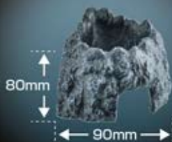
モイストシェルターコーナー160